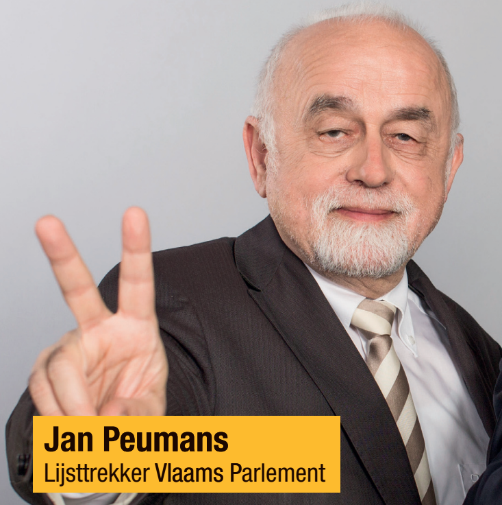
Jan Peumans Lijsttrekker Vlaams Parlement