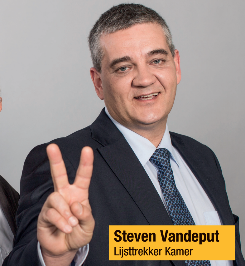
Steven Vandeput Lijsttrekker Kamer

Politici zijn er voor de burgers, de verenigingen, de ondernemingen, en niet omgekeerd. Politici moeten zuinig en doeltreffend omspringen met de beschikbare overheidsmiddelen, met úw geld.