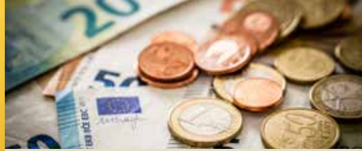
Bijna 2 miljoen extra voor Hamont-Achel (p. 2)