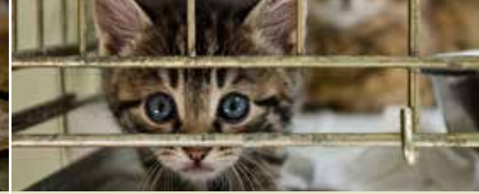
Actie vereist voor zwerfkatten (p. 3)