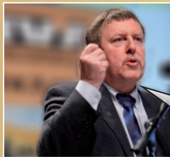
Siegfried Bracke N-VA-Kamerlid

“Ik stel keer op keer vast dat het onderscheid tussen CD&V, Open Vld en sp.a gewoon verdwijnt. Het zijn drie partijen die samen - en warmpjes - in het apparaat zitten. Kijk naar het debat over de gas- en elektriciteitsprijzen. Plots roept men energienetbeheerder Eandis uit tot vijand nummer 1. Laat me niet lachen. Wie bestuurt Eandis? Dat zijn 8 CD&V'ers, 4 sp.a'ers en 4 Open Vld'ers. Ook in die zin is de N-VA vandaag dé uitdager van het systeem.”