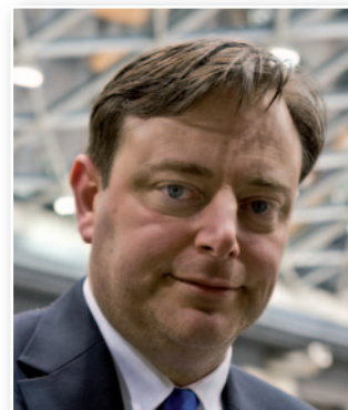
Bart De Wever, voorzitter N-VA

Overall in Vlaanderen schieten nieuwe afdelingen als paddenstoelen uit de grond. Het doet mij enorm plezier dat er sinds juni ook een lokale N-VA-afdeling opgestart is in Hamont-Achel. Ik kan u zelfs verklappen dat ik een persoonlijke band heb met jullie gemeente: mijn schoonfamilie is afkomstig uit Hamont-Achel. Ik wens de bestuursploeg van harte veel succes toe met de opstart van N-VA Hamont-Achel. Laten we samen, ook op gemeentelijk niveau, voor onze idealen gaan.