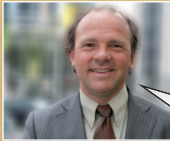
Philippe Muylers Vlaams minister van Financiën en Begroting

“Het Dexia-dossier hangt dit land als een molensteen om de hals. Als het verder fout gaat, stijgt de Belgische staatsschuld gigantisch. Ik vind dit gewoon hallucinant. De onbeantwoorde vragen stapelen zich ondertussen op. Maar Di Rupo zag geen beletsel om de Dexia-bestuurders kwijting te verlenen. Enkel het duidelijke ‘neen’ van de Vlaamse Regering deed de Belgische stem nog naar een ‘onthouding’ schuiven. Niet te begrijpen.”