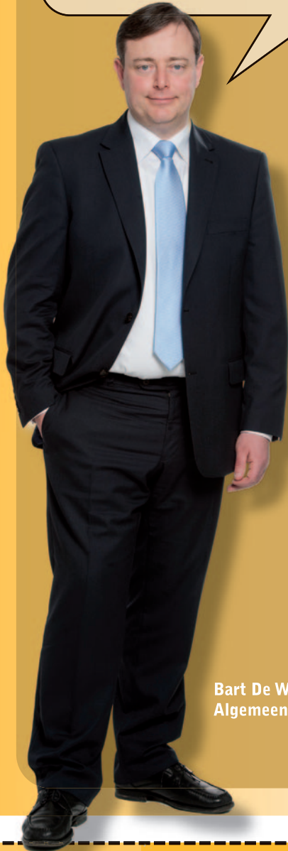
Bart De Wever Algemeen voorzitter N-VA

De N-VA kiest resoluut voor verandering. En ik vraag ook u om, samen met ons, die keuze te maken. Wil u de regering-Di Rupo weg, stem dan op 14 oktober op de N-VA!