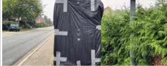
Politieke spelletjes ten koste van veiligheid (p.3)