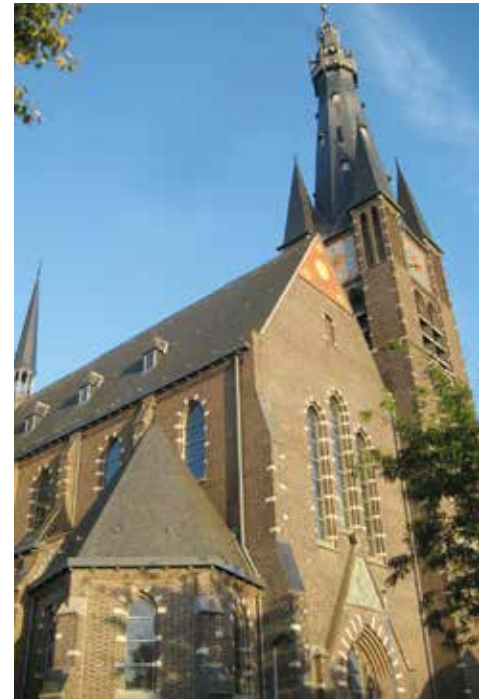
▲ Onze kerk heeft goede zorgen en opvolging nodig.

Voor en tijdens de ceremonie werden er gedachten uitgewisseld om de kerk in de toekomst nog meer te promoten bij onze toeristen.