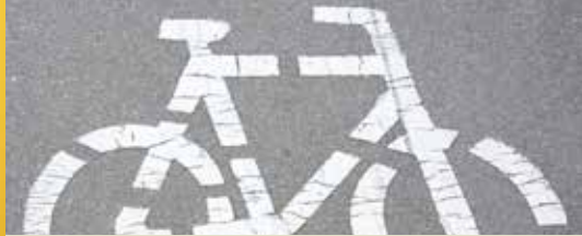
Infoavond fietsstraten succes. (p.2)