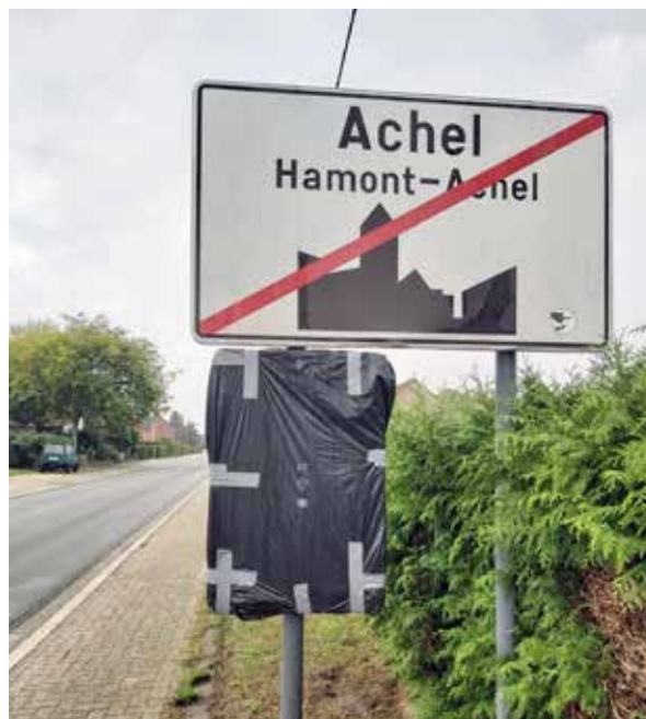
▲ De oppositie (CD&V en Balans) vindt politieke spelletjes blijkbaar belangrijker dan de veiligheid van onze fietsende kinderen.

Het lijkt ons dat sommige partijen de verkiezingsuitslag van 2018 nog niet hebben verwerkt. Wij anders wel. Vanaf de eerste dag van deze nieuwe bestuursperiode zijn we er volop ingevlogen om Hamont-Achel leefbaarder, veiliger en aangenamer te maken. En dat zullen we blijven doen tot de laatste dag van onze opdracht.