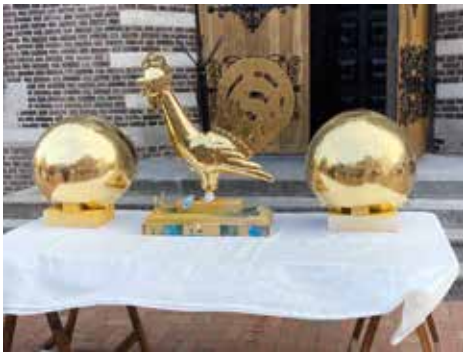
▲ De haan stond nog op de vorige kerk en is dus meer dan 100 jaar oud.