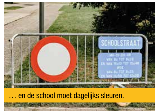
... en de school moet dagelijks sleuren.

maar is die echt zo duur omdat er zonnecellen op zitten? Voor die meerprijs legt men zonnepanelen op een hele woning! Trouwens, wie draait op voor de kosten van de werking, de verlichting en het openbare domein?