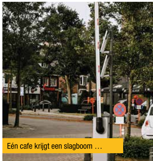
Eén cafe krijgt een slagboom ...

Na een eerdere beslissing van de huidige meerderheid werden de omstreden slagbomen in de Kerkstraat geplaatst. Waarom? Kost het echt zo veel moeite om wekelijks nadarhekken te verplaatsen? Waarom moet het schoolpersoneel van de school in de Berkenstraat in Achel Statie wél dagelijks met nadarhekken sleuren? De burger stelt zich vragen. En terecht!